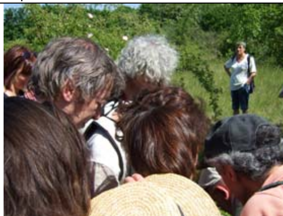
Manifestement c'est intéressant