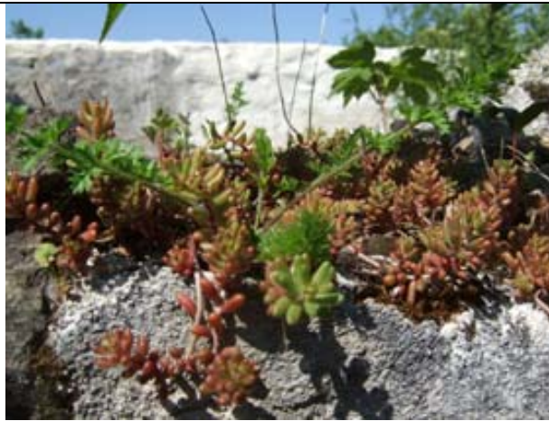
Sedum blanc et carotte sauvage ?