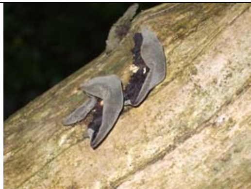
Oreille de midas sur bois mort