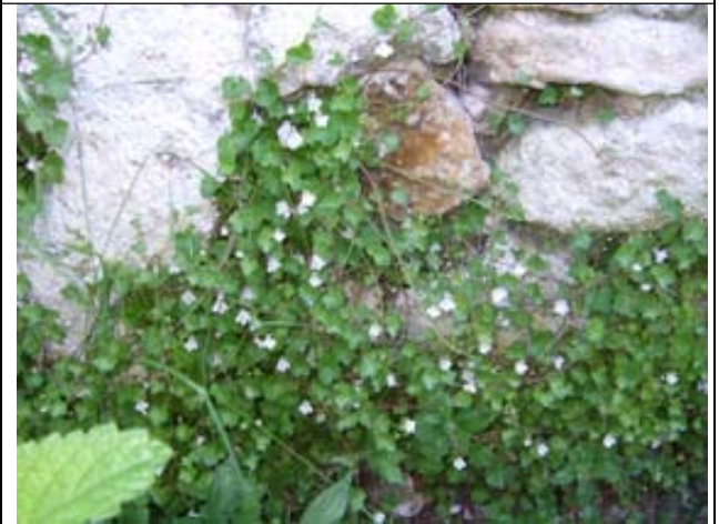
Ruine de Rome