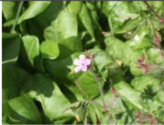
Géranium sur fond d'oseille