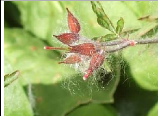
J'ai trouvé la touche macro