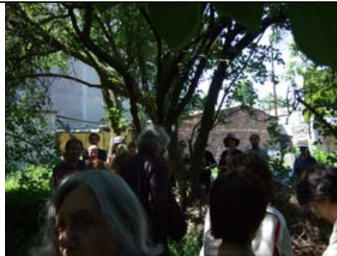
Entrée dans le bosquet