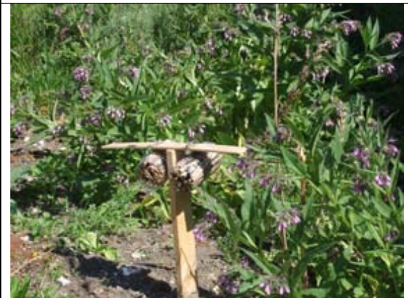
Auberge à insectes

Il n'y avait pas de vent, mais la punaise est floue ! Comment faire la mise au point ?