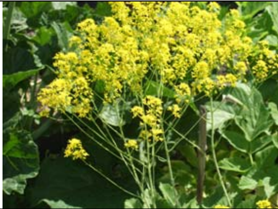
Pastel des teinturiers