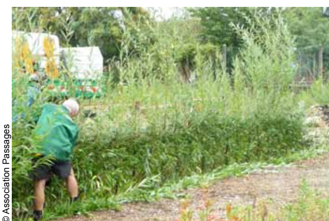
Taille en vert des pousses de l'année