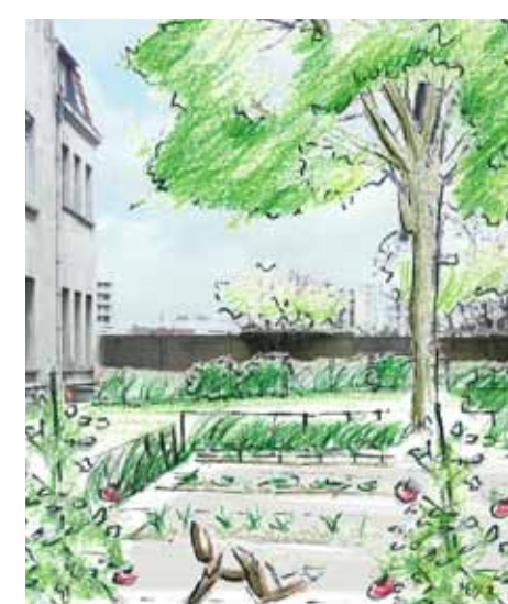
Essai 3 : Groupe scolaire A. France