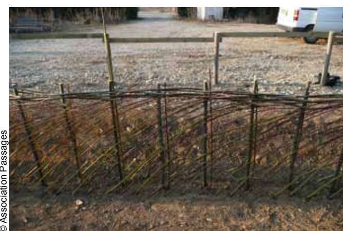
Aspect fini du tressage avant la feuillaison