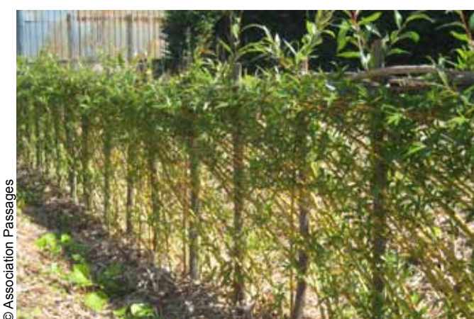
Aspect de la haie après la taille