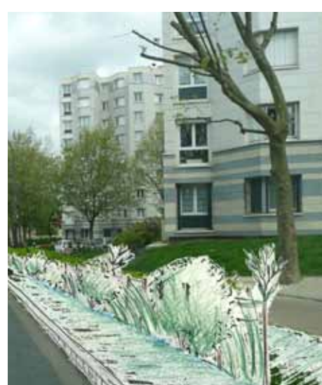
Essai 1 : Rue des Grands-Pêchers