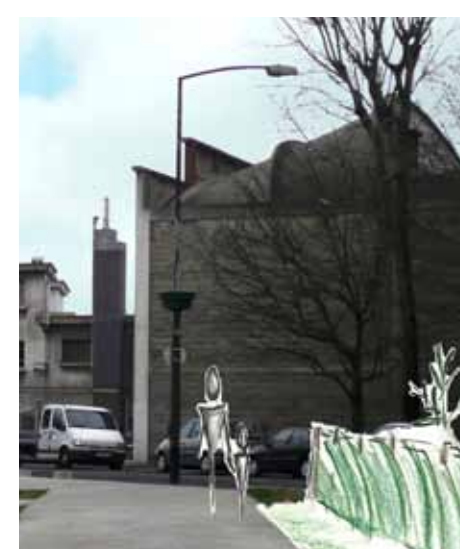
Essai 2 : Rue du Bel-Air