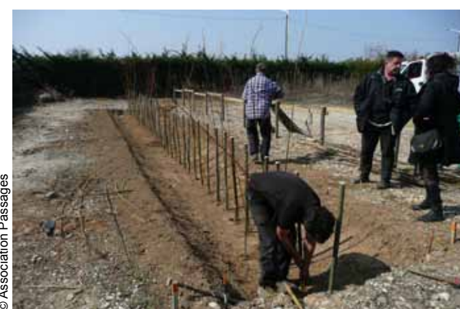
Mise en place des tuteurs et des boutures